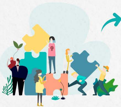
IMPLEMENTATION OF NEW POLICIES