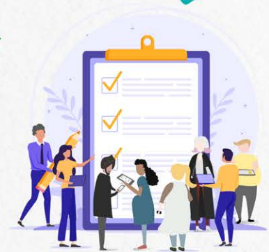
GOBERNANZA PARA LA TRANSICIÓN

Políticas alimentarias para la sustentabilidad