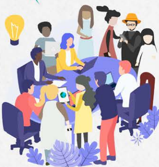
DEFINIÇÃO DE PROGRAMAS E AÇÕES

Políticas alimentarias para la sustentabilidad