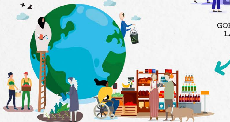
PRINCIPIOS XERAIS PARA SOLUCIÓNS (POLÍTICAS)